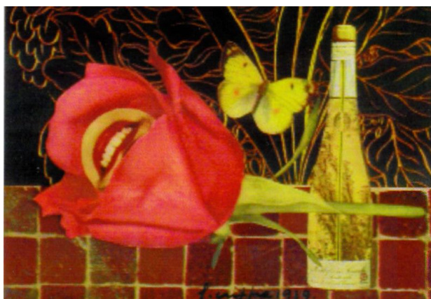
Luca Crippa: Collage , 1939

Il circolo Seregn de la memoria nell'ambito dell'assegnazione di premi e riconoscimenti ad enti ed artisti che si sono distinti in modo particolare per la loro attività nel campo culturale, organizzata dalla Sezione Monza e Brianza dell' Associazione Mazziniana Italiana , ha ricevuto il 22 novembre scorso a Monza, sala Maddalena, una menzione speciale per il venticinquesimo anniversario della fondazione con targa ricordo